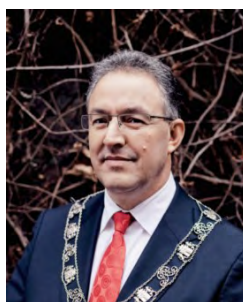
A. Aboutaleb Rotterdam/Regioburgemeester