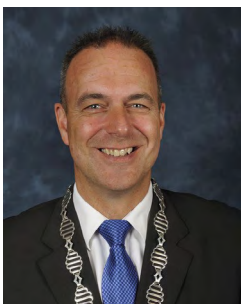
J. Paans Alblaserdam

De politie treedt bij de handhaving van de openbare orde en bij hulpverlening in een gemeente op onder gezag van de burgemeester. Bij strafrechtelijke handhaving staat de politie onder gezag van de (hoofd)officier van justitie. De politiechef is belast met de dagelijkse aansturing van de politie-eenheid. De burgemeesters en de hoofdofficier van justitie bepalen samen met de politiechef de prioriteiten voor de politie, verdelen de politiesterkte over de onderdelen van de politie-eenheid en stellen jaarlijks het jaarverslag van de politie vast. Ook voeren zij het beheer over de gezamenlijke veiligheidsvoorzieningen, zoals het Regionaal Informatie- en Expertise-centrum (RIEC), Veiligheidshuizen en de VeiligheidsAlliantie regio Rotterdam (VAR). Zij komen bijeen in het Regionaal Veiligheidsoverleg (RVO) onder voorzitterschap van de regioburgemeester.