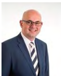
M. Vroom Krimpen a/d IJssel