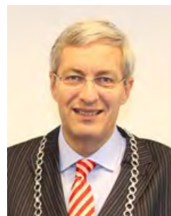
A. Borgdorff Binnenmaas