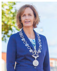
M. Junius Hellevoetsluis