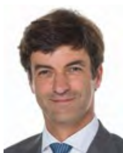
P. van der Stadt Lansingerland