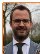
Lopik, L. de Graaf