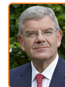
Utrecht