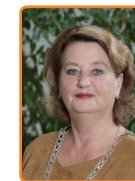
Laren, R. Kruisinga