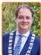
Leusden, G. Bouwmeester