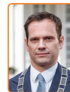
De Bilt, S. Potters