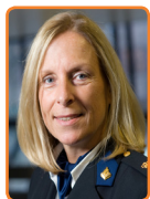
Politie Midden- Nederland, G. van Leeuwen