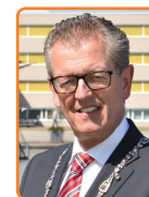
Zeewolde, G. Gorter