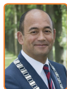
Wijdmeren, F. Ossel