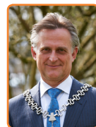
Soest, R. Metz