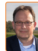
Noordoostpolder, H. Bouman