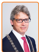
Amersfoort, L. Bolsius