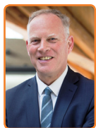
Gooise Meren, H. ter Heegde