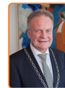
Huizen, S. Helldoorn