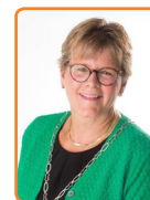
Woudenberg, T. Clossen