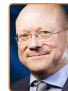
De Ronde Venen, M. Divendal