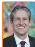
Rhenen, J. van der Pas