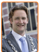
Oudewater, P. Verhoeve