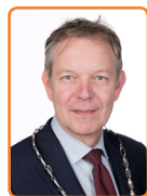
Baarn, M. Röell