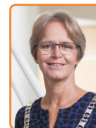
Stichtse Vecht, Y. van Mastrigt