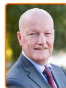
Bunnik, R. van Bennekom