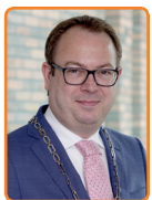
Eemnes, R. van Benthem