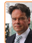
Openbaar Ministerie, R. Jeuken