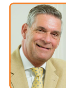
Utrechtse Heuvelrug, G. Naafs