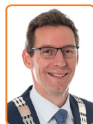
Wijk bij Duurstede, T. Poppens