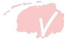
Tabel 2. Doelen en resultaten verdachten online kindermisbruik voor 2020