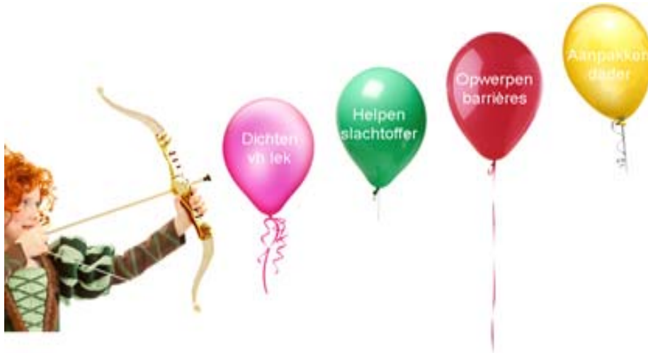
Figuur 2 Mogelijke interventies

op de persoonlijke levenssfeer en in veel voorkomende criminaliteit die gepleegd wordt met behulp van internet, zoals internetoplichting, stalking, bedreiging en belediging, waarbij het volume aan slachtoffers bij één dader vaak groot is. De indeling is niet strikt, elke zaak staat op zich. Ondermijnende criminaliteit kan bijvoorbeeld gepaard gaan met veelvoorkomende criminaliteit (VVC) en met High Impact Crimes (HIC), maar deze indeling in ernst, haal en/of brengzaken en complexiteit biedt een mogelijkheid om de verschillende interventiestrategieën te beschrijven. Een interventiestrategie bestaat uit een mix van verschillende mogelijke interventies zoals afgebeeld in Figuur 2.