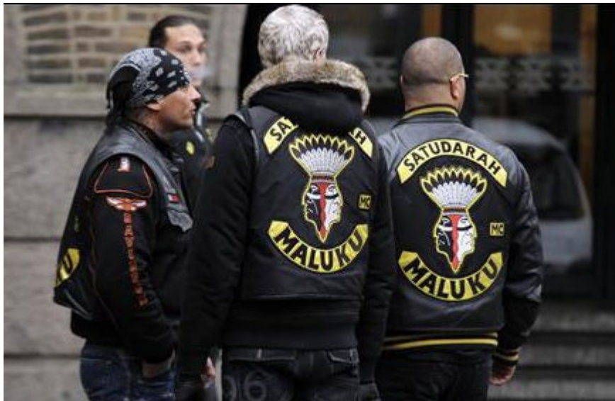
Leden van motorclubs mogen in het festivalgebied van de TT in Assen geen herkenbare clubkleding en logo's dragen, vanwege spanningen tussen OMG's.

De informatiepositie ten aanzien van Outlaw Motor Gangs is verbeterd. Bekend is welke motorclubs er in Noord-Nederland zijn en welke contacten zij onderling onderhouden. Ondanks de inspanningen van partners laten de OMG nog steeds een sterke groei zien in chapters en leden. De identiteit van de leden is grotendeels (275) bevestigd. Evenementen van motorclubs worden gemonitord, aan strikte vergunningsvoorwaarden verbonden en niet gefaciliteerd.