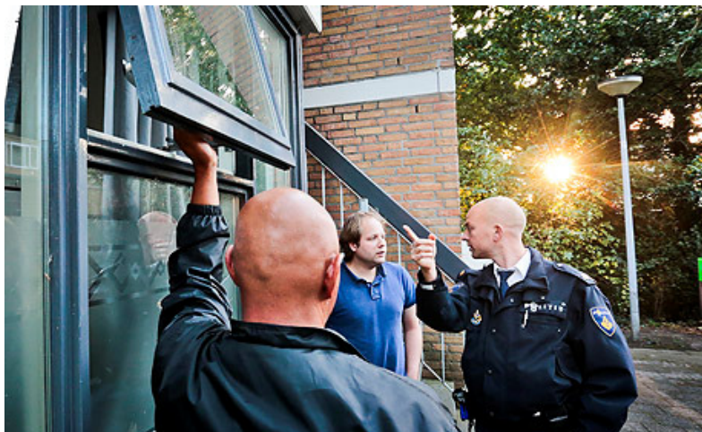
Vrijwel alle noordelijke gemeenten zijn actief met preventieactiviteiten in wijken waar veel ingebroken wordt, vooral tijdens de donkere dagen.

Ook in de donkere maanden blijft het aantal woninginbraken dalen. Het district Drenthe wint de Harm Alarm Bokaal, omdat zij in december landelijk de grootste daling (63 procent) van het aantal woninginbraken realiseert ten opzichte van december 2013. Voor heel Noord-Nederland is dit een daling van 45 procent. Bij de uitreiking roemt minister Opstelten van Veiligheid en Justitie de goede samenwerking tussen bestuur, Openbaar Ministerie, politie en burgers bij de aanpak van woninginbraken.