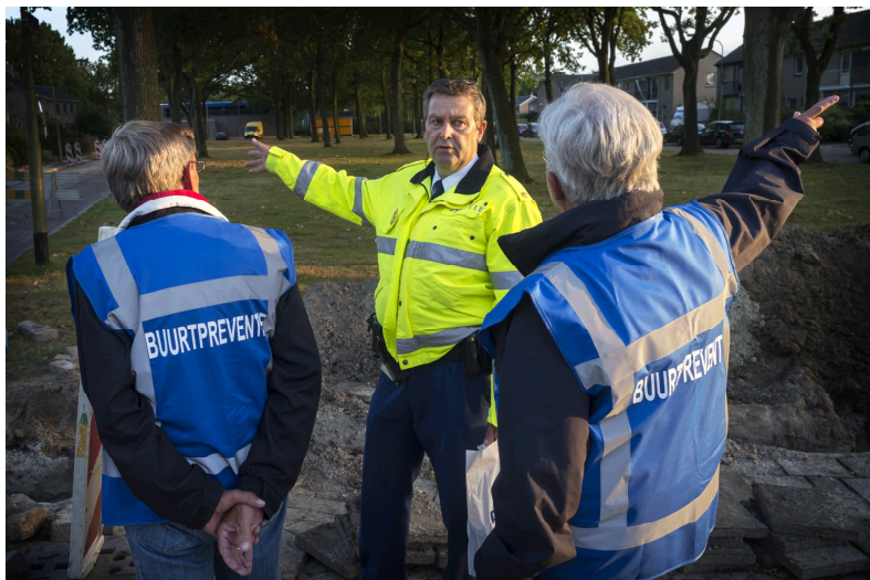
In meerdere gemeenten zijn buurtpreventieteams actief die een oogje in het zeil houden om de veiligheid in hun wijk of buurt te vergroten.

Een plan van aanpak moet de samenhang tussen heterdaadkracht en burgerparticipatie versterken. De politie en gemeenten vragen burgers actief om verdachte situaties eerder te signaleren en melden. Denk hierbij aan projecten als WAKS!, buurtpreventieteams, Whatsapp-groepen, de workshop 'Melden van verdacht gedrag' en Burgernet.