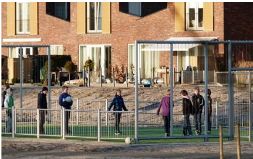
In Sneek leidt een pannakooi tot overlast van jongeren. Goede afspraken met alle betrokkenen leiden tot meer begrip en de overlast stopt.

Op grond van de nieuwe Drank- en Horecawet stellen de gemeenten wettelijk verplichte preventie- en handhavingssystemen op ter voorkoming van alcoholgebruik door jeugdigen. Een groot deel van de gemeenten handhaaft deze plannen door inzet van boa's en nalevingsonderzoeken, vaak in nauw overleg met de politie. De focus ligt op het schenken en verkopen aan minderjarigen. De politie neemt contact op met ouders wanneer ze hun kinderen beschonken aantreft.