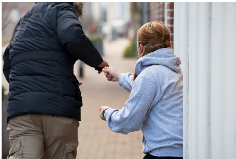
Het aantal straatroven in Noord-Nederland daalt met zestien procent..

De gemeenten organiseren of faciliteren preventieactiviteiten voor lokale ondernemers, met name in de grote steden. Een voorbeeld hiervan is de roadshow 'Laat je niet overvallen' voor ondernemers in de gemeenten Sneek, Emmen en Hoogeveen. Een initiatief van de gemeenten in samenwerking met het Centrum voor Criminaliteitspreventie en Veiligheid (CCV), waaraan ook de politie en OM meewerken.